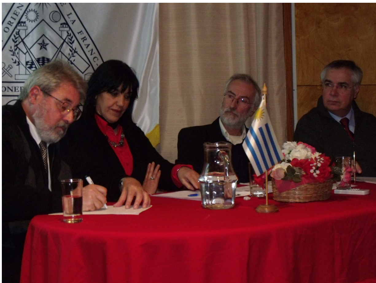
La Mesa del 7º Encuentro Nacional del REAA: